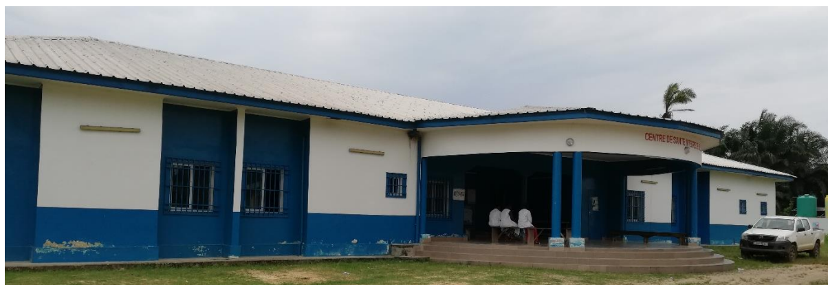
Transformation du CSI de Bilala en Hôpital de base, Photo de 2019.

Les Centre de Santé Intégré (CSI) de Bilala et de Madingou Kayes élevés au rang d'hôpitaux de base depuis 2018 continuent de fonctionner comme des CSI à Paquet Minimum d'Activités Elargies (PMAE) par manque de logistique et de compétences requises au sein des agents qui animent ces structures. Les promesses d'accompagnement en matériel et d'affectation du personnel faites lors de la cérémonie d'élévation de niveau de ces deux structures sont restées lettres mortes et les populations continuent à se déplacer pour se faire soigner à Pointe Noire.