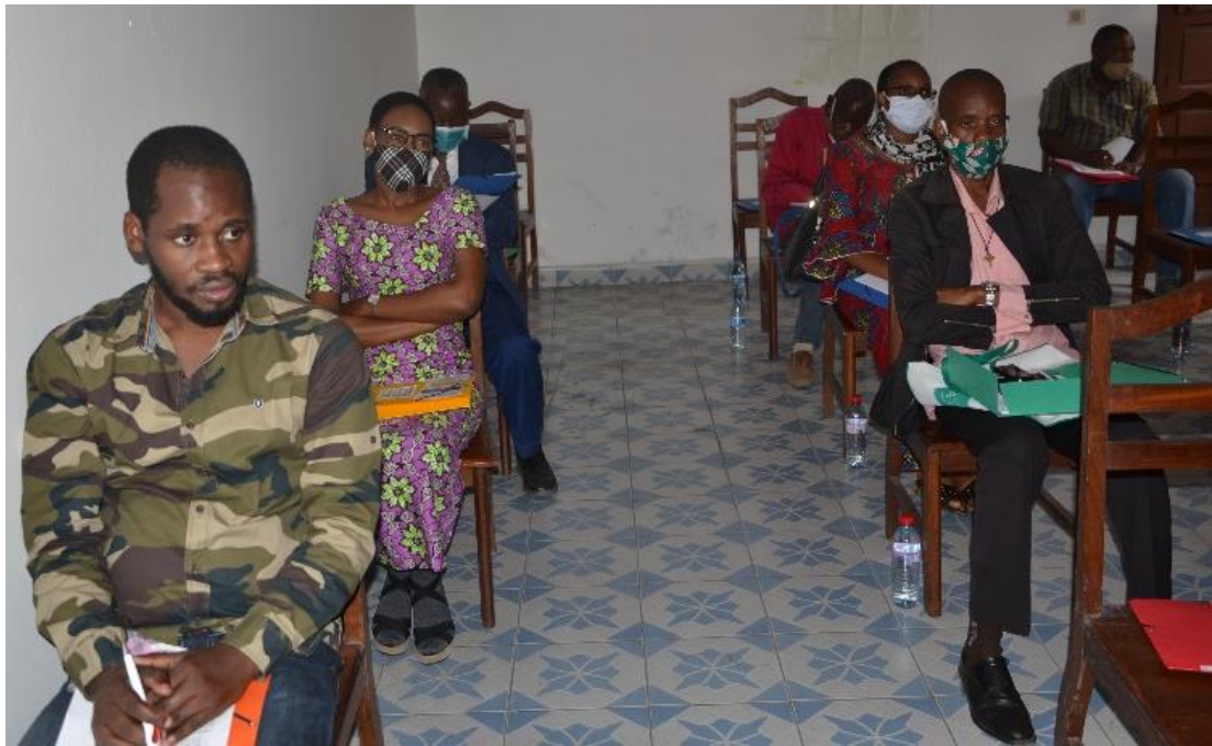
Séance de de formation du 5 aout 2020 à Brazzaville.