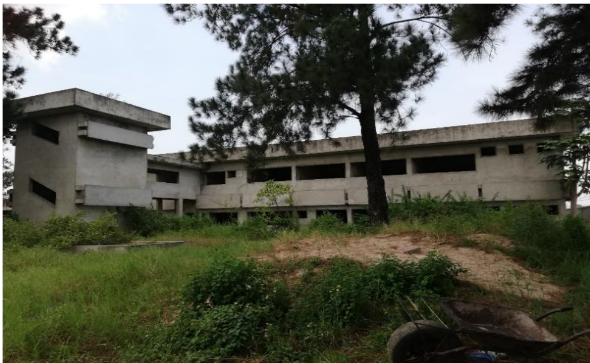
Chantier de construction de l'Hôpital de base de Ouenzé (Ex CNSS), en arrêt depuis 2012. Photos du 18 mars 2019.

« A quoi a servi le budget d'investissements du Ministère de la Santé en 2019 ? »