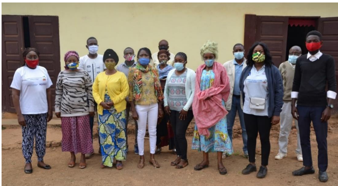
Photo de groupe à l'issue de la formation de Dolisie, le 3 août 2020.

Dans le souci de renforcer l'appropriation des techniques de suivi des projets par les groupes locaux de suivi des investissements publics, une mise à niveau des capacités des membres a été jugée nécessaire. Aussi, une mise à niveau des capacités des membres des groupes locaux de suivi des budgets a été organisée de Juillet à Septembre 2020 au profit de 89 personnes . En raison de la détérioration de la route nationale N°2 qui dessert la partie nord du pays, sept formations se sont réalisées en présentiel (Pointe Noire, Dolisie, Nkayi, Sibiti, Kinkala, Brazzaville et celle au profit d'un membre du groupe local d'Owando présent à Brazzaville), et trois par téléphone (Djambala, Ouesso et Impfondo). A l'issue de ces formations, 28 observateurs ont été déployés pour suivre l'état d'avancement des projets ciblés et réaliser l'inventaire de l'équipement des hôpitaux dans leur département respectif.