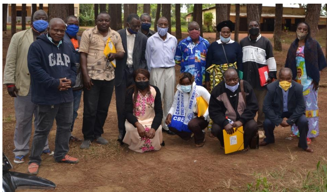
Photo de groupe à l'issue de la formation de Sibiti, le 4 août 2020.