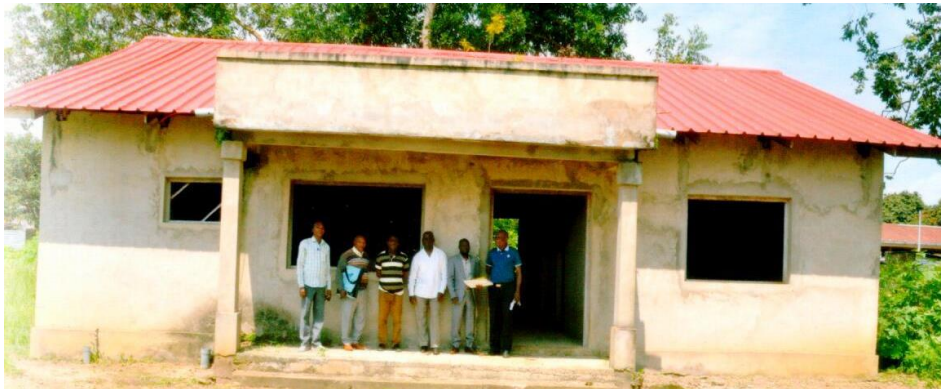
Pharmacie du DS d'Ewo, photo de 2019.