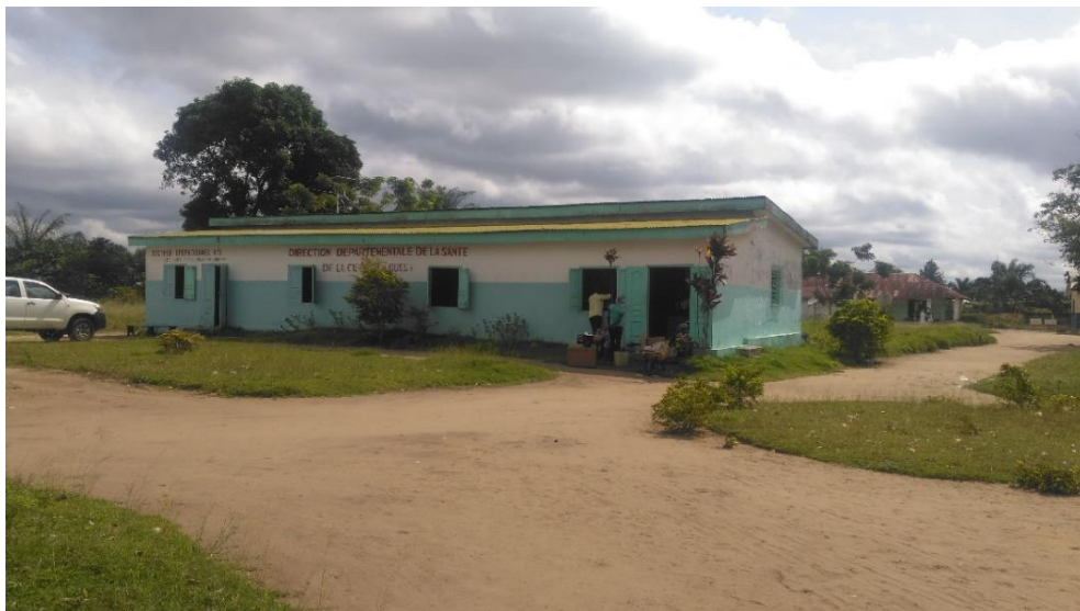
La Direction Départementale de la Santé et de la Population de la Cuvette Ouest (Ewo).

Depuis 2012, le gouvernement avait prévu de construire des sièges de districts sanitaires et leurs pharmacies dans tous les chefs-lieux de départements. Sur le terrain, très peu de réalisations sont visibles. On citera par exemple, la pharmacie de district sanitaire de Nkayi construite et fonctionnelle depuis 2017, et la réhabilitation du DDS de Madingou en 2020. Les autres chantiers peinent à avancer et sont considérés, dans le cadre de notre évaluation, comme projets abandonnés. N'étant plus inscrits au budget depuis 2014, pour les sièges, et 2018 pour les pharmacies, on se demande s'ils ont été complètement financés.