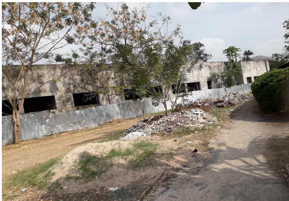
Centre hémodialyse de Brazzaville en arrêt. Photo du 18 septembre 2020.