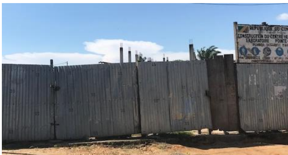
Centre hémodialyse de Pointe Noire en arrêt. Photo du 9 novembre 2020.