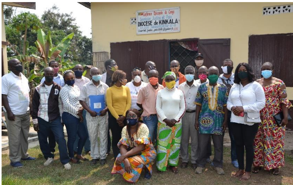
Photo de groupe à l'issue de la formation de Kinkala, le 7 aout 2020.