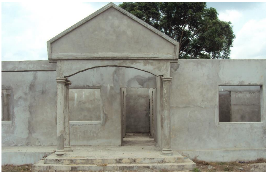
Pharmacie du DS de Djambala, photo de 2019.