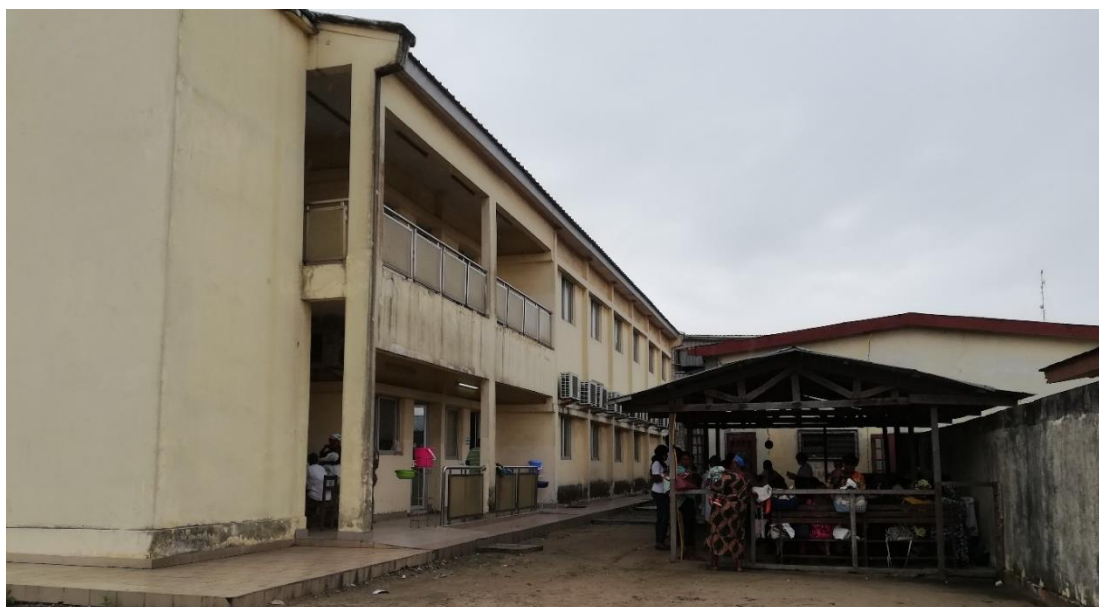
L'unique bâtiment de l'hôpital de base de Mvou-Mvou finalisé, équipé et utilisé comme maternité du Centre de Santé Intégré du même nom. Photo de Septembre 2020.

Bon nombre de ces projets ne sont plus repris dans le budget. On se demande alors ce qu'ils adviendront, vu que la plupart se dégradent déjà à cause des intempéries. Des alternatives ont cependant été trouvées pour certains. C'est le cas de l'hôpital de base de Mvou-Mvou. Dans le souci de rapprocher les femmes de l'Arrondissement 2 du centre d'accouchement et de préserver le bâtiment qui se dégrade déjà du fait de son inoccupation durant six ans, le rez de chaussée de son bâtiment a été mis en service, comme extension de Centre de Santé Intégré du même nom, avec l'ouverture du Service de Maternité au début du mois de Septembre 2020. Même si cette initiative est très appréciée aussi bien par le Comité de Santé, la hiérarchie de la structure que la population de Mvou-Mvou, une inquiétude subsiste cependant quant à la poursuite de ce projet qui a disparu des prévisions budgétaires depuis 2015. Toutes ces situations constituent des obstacles à la politique sanitaire préconisée par le gouvernement et retardent l'atteinte de objectifs visés par le programme « Santé pour tous »