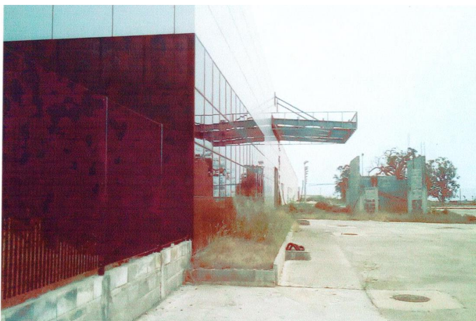
Chantier de l'hôpital général de Loango en arrêt depuis 2016. Photo de 2019.

Se trouvent dans cette catégorie, les travaux de construction des hôpitaux généraux. La construction des hôpitaux généraux demeure une préoccupation quant on sait qu'en 2019 aucun chantier n'était arrivé à termes en dépit des promesses de finalisation des Hôpitaux de Brazzaville et Pointe Noire faites par les autorités congolaises et l'imminente relance des travaux annoncée à Madingou et Djambala, au cours de la même année. Cependant, on notera, qu'en 2021, une avancée a été constatée pour les Hôpitaux Généraux de Patra et Nkombo dont l'inauguration est prévu avant fin 2021. Par ailleurs, on déplore la détérioration, du fait des intempéries, des bâtiments à l'abandon et des matériaux stockés dans des conteneurs sur les sites de construction de certains hôpitaux. De même, les pratiques de détournement des matériaux de construction signalées dans le précédent rapport se poursuivent. Après Ouesso, c'est au tour de l'hôpital général de Djambala de se voir dépouiller au profit d'Oyo et Brazzaville. Alors que dix hôpitaux sur les douze peinent à être finalisés, leur équipement a déjà été prévu depuis 2018, au point où l'on se demande s'ils ont été totalement financés.